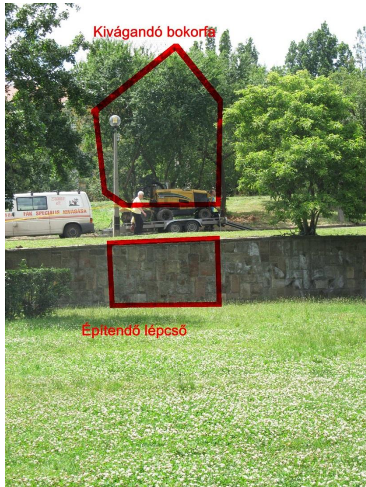
Kivágandó bokorfa és építendő lépcső helye

A Hármashalom elhelyezése úgy kellene történjen, hogy az azzal szemben megálló ember balra tekintve az Országzászlót is láthassa. Ehhez egy bokorfa kivágása szükséges.