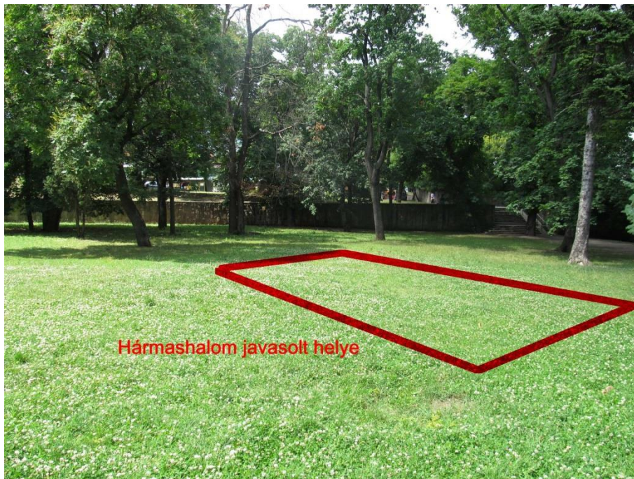
Hármashalom javasolt helye

A Hármashalomnak a park egyéb pontján történő elhelyezése esetén annak jelentősége degradálódna, a két alkotás mellérendeltségi viszonya nem lenne megvalósítható. Ezért vizsgáltuk meg a kissé tágabb környezetet, aminek során úgy gondoltuk, hogy méltó helye lehetne a Hármashalomnak a Pyrker térnek a Székesegyház oldalsó bejárata melletti parkrészen, az érseki rezidencia és a buszpályaudvarhoz vezető, széles gyalogút közötti területen. Így önállóan elhelyezve a Hármashalom is kiemelt jelentőségű alkotásként jelenne meg.